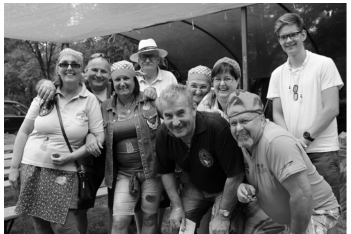
Nagykőrösi Motorosok csapata