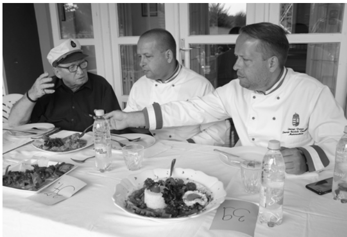
Zsűri munka közben