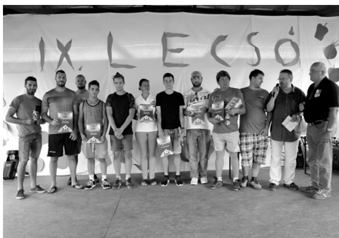
Lecsó kupa eredményhirdetése