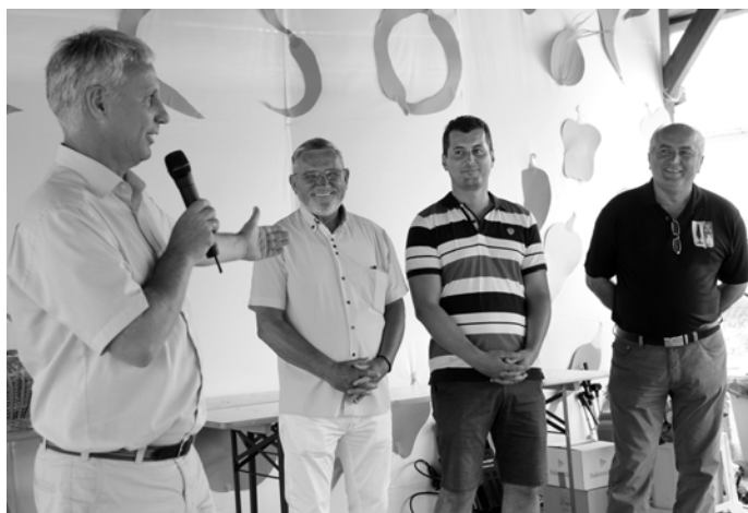
Soltész Miklós államtitkár úr köszöntője