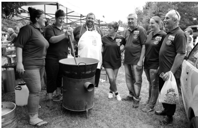
Zölden Friss csapata